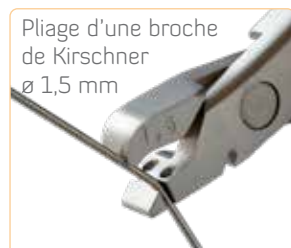
Pliage d'une broche de Kirschner Ø 1,5 mm

Lors du pliage, la broche est repoussée par le nez de la branche supérieure et guidée par une petite gorge.